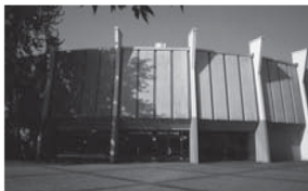
An de Tent 11 - 46483 Wesel