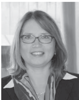
ULRIKE WESTKAMP BÜRGERMEISTERIN STADT WESEL

Die kommende Spielsaison 2013/2014 wird dem Badminton-Verein Wesel Rot-Weiss e.V. in der 2. Bundesliga wieder alles abverlangen.